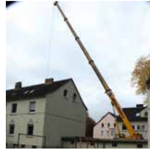
Ein eingespieltes Team baute die Balkone professionell auf, dann kamen sie an den Haken, wurden ans Haus gehievt und hier verankert.