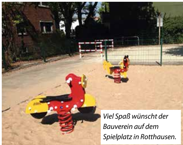
Viel Spaß wünscht der Bauverein auf dem Spielplatz in Rotthausen.

Neue Palisadenwälle, eine weitere Bank für die Nachbarn und Berge neuen Sandes rundeten die Arbeiten ab. Noch im September konnte der Spielplatz von den Kindern wieder genutzt werden.